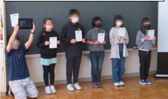
認証式の様子、骨折のためオンラインで参加する児童も