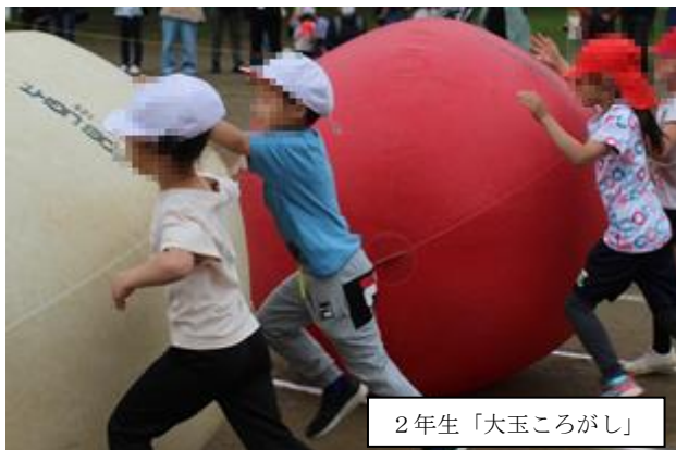
2年生「大玉ころがし」

6月15日(水)、延期されていた2年生の運動会を行いました。保護者の皆様には、仕事の都合などを調整していただき感謝申し上げます。2年生は徒競走と大玉ころがしに一生懸命に取り組みました。ご観覧いただきどうもありがとうございました。尚、5年生の運動会は7月4日に延期しています。さらにご協力に感謝申し上げます。