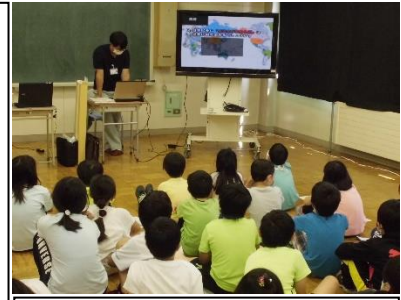
上下水道のしくみを学ぶ4年生

感染防止策を徹底した上で、外部講師を招聘して行う「おびひろ市民学」が始まりました。7/30(木)には4年生が市民の生活を支える市の水の仕組みについて学びました。