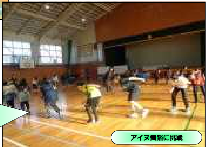
アイヌ舞踏に挑戦

「バッタの踊り」である、バッタキ ウポポ。今から100年以上前、十勝地方にバッタが大量発生して、作物が大変な被害にあいました。その様子を後世に伝えていこうと作られたものがバッタキ ウポポです。昆虫の動きを基にした独特な踊りの一つだそうです。腰を曲げたまま、手を前に出したり肘を高く突き上げたり、また脚はお尻につけるように跳ね上げるなど、バッタになりきった4年生です。