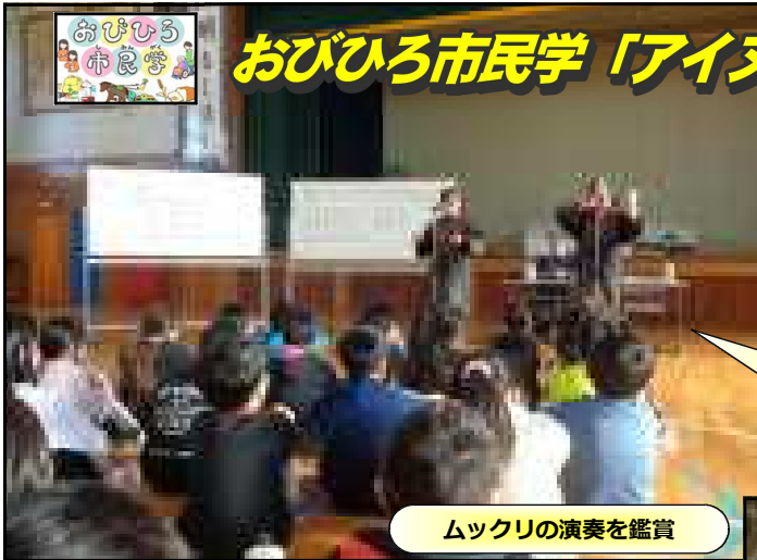
ムックリの演奏を鑑賞

4年生は社会科でも十勝のアイヌ文化について学びます。今回は、帯広カムイトウウポポ保存会の方々にご来校いただき、アイヌに伝わる楽器や舞踊を教えてくださいました。