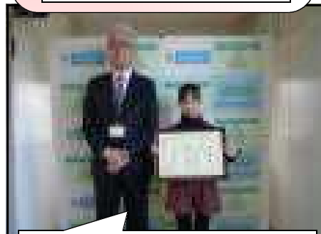
十勝総合振興局 産業振興部