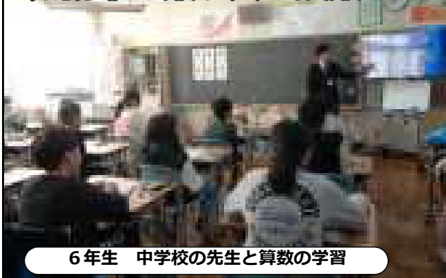
6年生 中学校の先生と算数の学習

翔陽中学校の数学の先生が来校してくださりました。6年生にとってみれば、中学校生活は楽しみでもあり、不安もあると思います。4月に良いスタートがきれるように、今からの準備が大切です。中学校の授業の雰囲気を感じ、「いよいよ中学生」という気持ちが高まってきたようです。