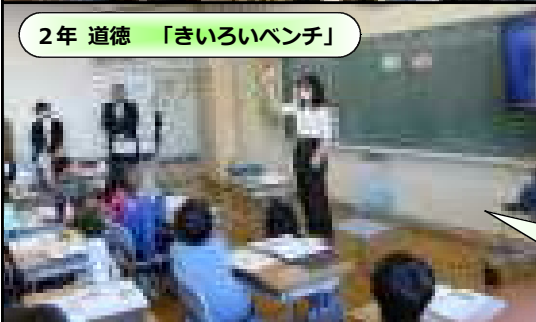
2年 道徳 「きいろいベンチ」

学校生活で権利と義務が重なったとき、どうすればよいのかをグループワークなどを通して学び、学校生活だけでなく、将来どんな場面でも役に立つ、大切な力を身に付ける授業に取り組んできました。