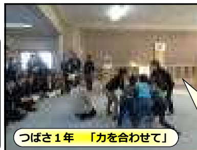
つばさ1年 「力を合わせて」

日々の授業研究に終わりはありません。今後も研修を深め、学習形態や学びの振り返りに着目し、ICTを適切な場面で効果的に活用しながら、深い学びが実感できる授業を目指していきます。