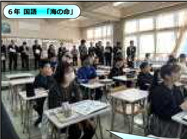
6年 国語 「海の命」

この単元では、物語を通して登場人物の生き方について考え、それを交流することで考えを広げてきました。単元のゴールに向けて、主人公 太一の生き方を紹介するポスターを作ります。毎時間の学びを蓄積してポスターを完成することで、自分の考えを形成する授業に取り組んできました。