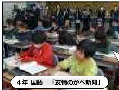
4年 国語 「友情のかべ新聞」

この教材はミステリーです。「なぜだろう？」と思うことを論理的に考え、謎解きの楽しさを感じることが大切です。心の距離は、どうやって縮まったのかな。その謎を解明していきました。