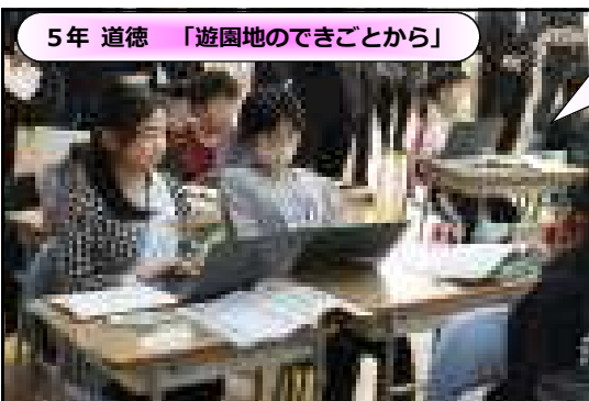
5年 道徳 「遊園地のできごとから」

身近な場所を題材にした教材を通して、権利を主張するときに必要なことを考えました。