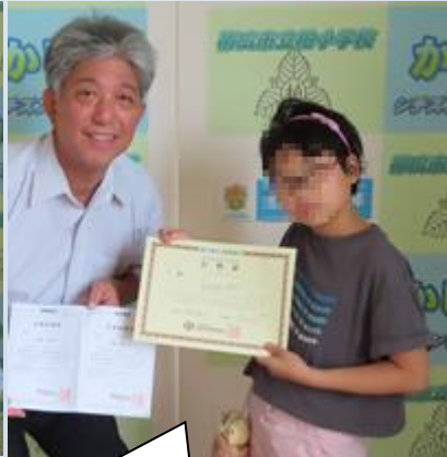
実用数学技能検定 7級合格 4年 さん