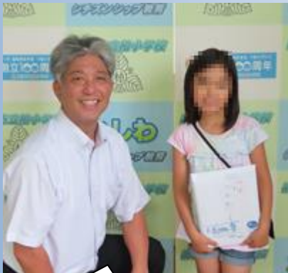
子どもの詩「サイロ」 入選 1年 さん