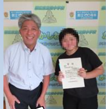
第47回おびひろ動物園動物 画写生コンクール 佳作 6年 さん