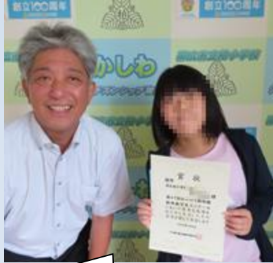
第47回おびひろ動物園動物 画写生コンクール 佳作 5年 さん