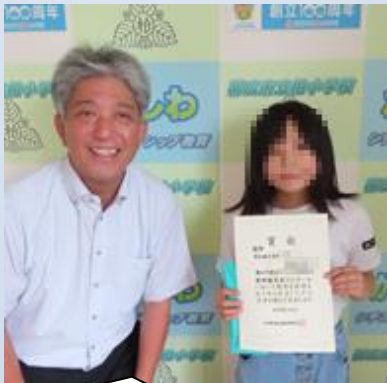
第47回おびひろ動物園動物 画写生コンクール 佳作 5年 さん

「がんばる柏っ子」の2学期の第3回は、剣道の大会や絵画・書道のコンクール、子どもの詩「サイロ」で入賞したお友達と、数学技能検定で合格したお友達の紹介です。入賞・合格おめでとうございます。