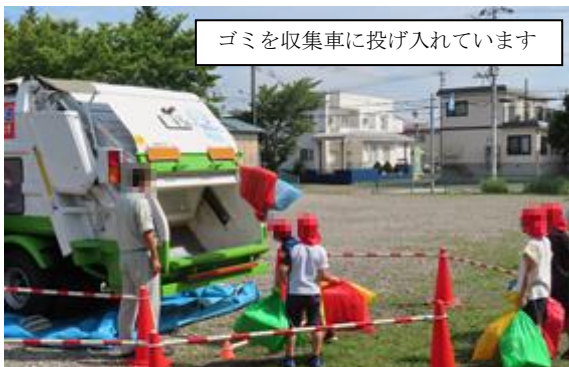
ゴミを収集車に投げ入れられています

9月6日におび学の出前授業として、4年生が市の清掃事業課の方々に講師にゴミの収集について学びました。子どもたちは家庭でのゴミ出しのお手伝いも頑張っているようで、質問に答えながら分別の仕方を改めて確かめたり、カラスにゴミステーションを荒らされないような仕組みについて考えたり、深く学ぶことができました。最後にゴミ収集車がゴミを圧縮して積み込む様子を見てその力強さに驚いていました。