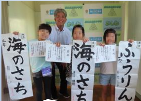
日本習字全国たなばた競書大会 銀賞 3年 さん 銀賞 3年 さん 銀賞 1年 さん