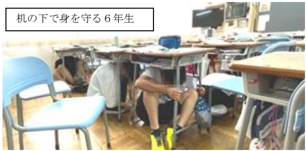
机の下で身を守る6年生

柏小学校では、先月の避難訓練に続き、シェイクアウト訓練を行いました。地震があったと想定して、「Drop（まず姿勢を低く）」「Cover（頭を守り）」「Hold On（動かない）」の3つの動作を行いました。子どもたちは短時間で机の下に入り、頭や体を守ることができました。