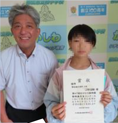
第47回おびひろ動物園動物 画写生コンクール 佳作 6年 さん