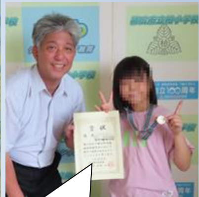
第57回全十勝少年剣道団体優 勝大会 小学生中学年女子の部 優勝 帯広の森体育館チーム 4年 さん